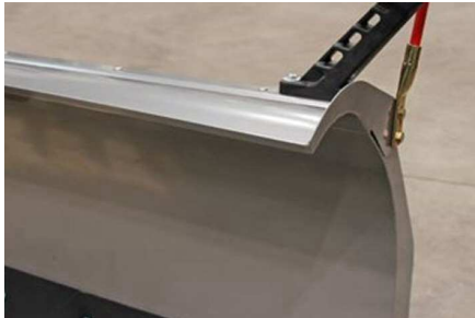
Défecteur en acier ( option )