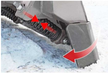
Lame avec ressorts de rappel