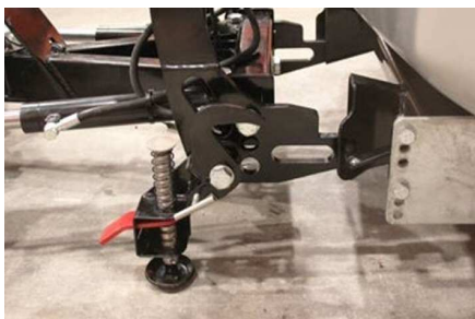
Attelage rapide avec poignée