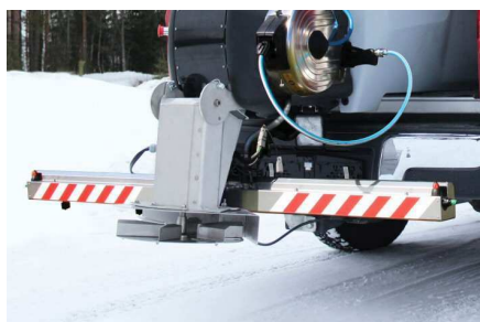
Enrouleur et rampe de pulvérisation