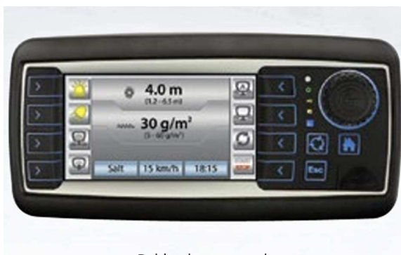
Boîtier de commande