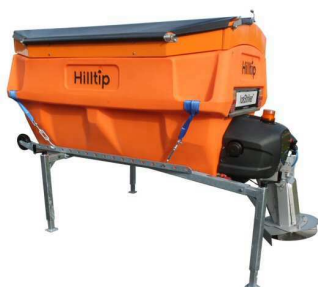
Châssis de dépose