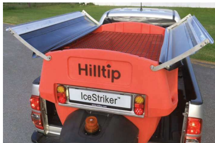
Système de bâche et grille