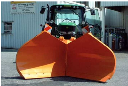
Etrave en position godet