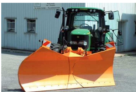
Etrave en position lame biaise