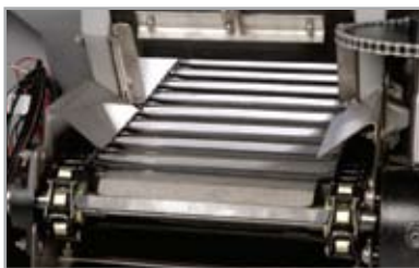
CONVOYEUR À CHAÎNE, À PIVOT, EN ACIER et logement en acier inoxydable anticorrosion alliant une conception éprouvée en termes de rendement optimal dans le secteur.