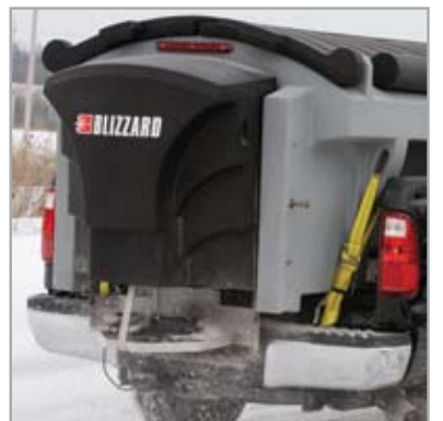
L'ENSEMBLE GLISSIÈRE EXCLUSIF hauteur plateaux L'ensem sonde en antirouille pour le r